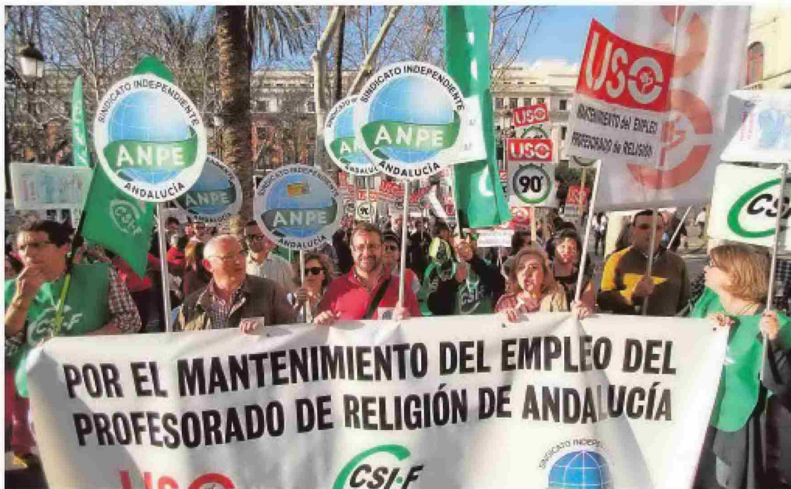
Manifestación en Sevilla de profesores de Religión que perdieron su trabajo tras la orden de la Junta